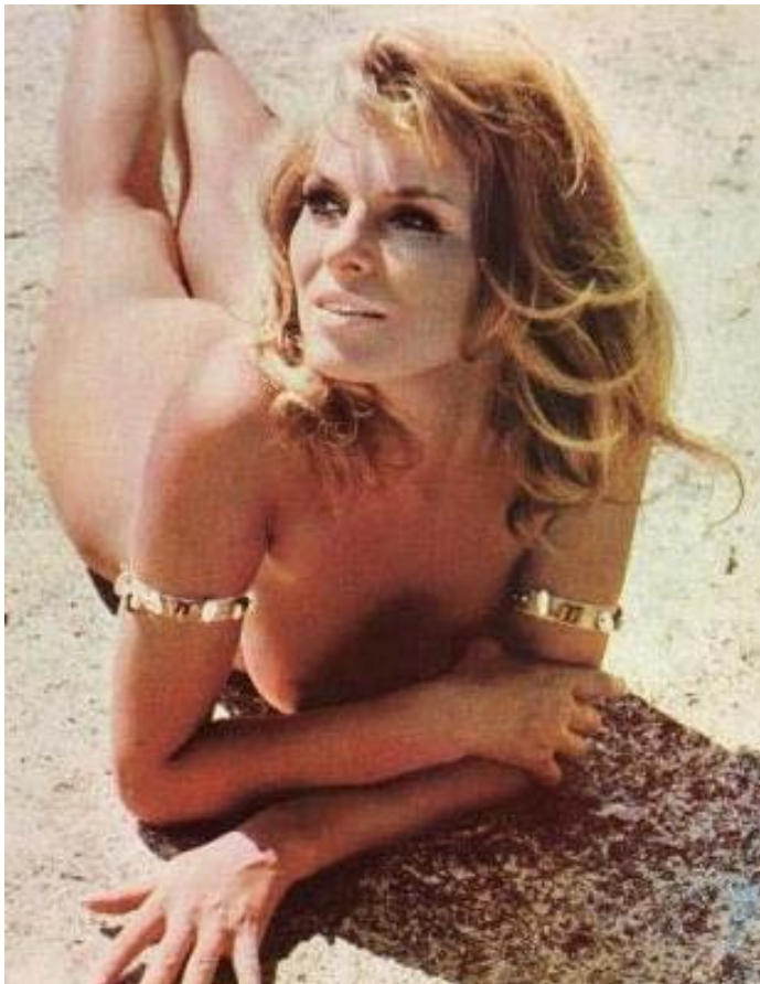
Typisk sandnesjente. Det er mye flott i Norge!