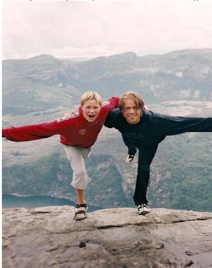
Kritikk er en balansegang. Her en annen balansegang: To unge menn med et 597 meters stup, også kalt Preikestolen, ti cm bak hælene. Pappa var ikke helt obs...

For å plage dere med enda flere tall: De fire NTA-årgangene med meg som redaktør inneholdt totalt 972 sider. Det blir 243 sider per årgang, og 61 sider per nummer. Det er neppe til å unngå at dette er en standard som NTA kan bli målt etter framover. La oss derfor håpe at mange nok bretter opp armene, slik at NTA kan komme ut både regelmessig og fyldig. Jeg ønsker alle involverte lykke til med dette, selv om jeg gjør oppmerksom på at menneskelig skrøpeligheit kan opptre som smålighet: De færreste som trekker seg ut av noe håper nok at ting skal gå dramatisk bedre når andre tar over. På den andre siden er det vel få som er så bitre og hevngjerrige at de håper at ting skal gå helt i toalettet. Derfor gjentar jeg mitt lykke til!