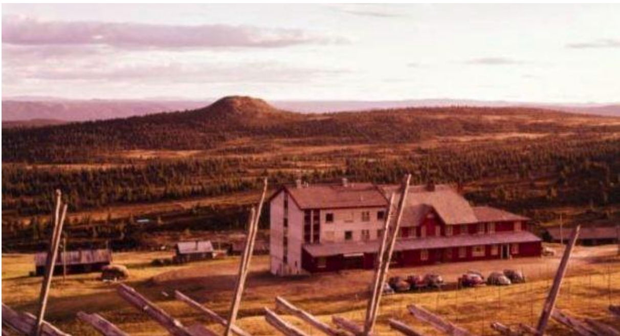
Storefjell Resort, om enn ikke i dagens utgave eller med dagens navn. Skal vi tippe sent 1950–tall? I så fall er det 30 år før NAFO kom dit for første gang i 1988, som er 33 år siden! Mye har skjedd...