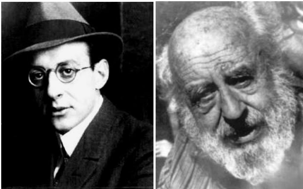
En ung og en eldre utgave av Fritz Perls (1883–1970).

Alt i alt har ting gått rette veien, nettopp av de nevnte grunnene. Derfor siterte jeg til og med et visdomsord som visstnok skal stamme fra gestaltpsykiateren Fritz Perls: "Don't push the river, it flows by itself." Ikke bare er det unødvendig, det kan være direkte dumt. Da har jeg nevnt det viktigste fra selve debatten om retningslinjer. Hvis jeg skal legge til noe, må det være at jeg spurte hva retningslinjene eventuelt skulle inneholde. Skulle de være generelle, og dermed en samling selvfølgeligheter, som "Bruk mest mulig positiv forsterkning og minst mulig straff"? Eller skulle de være detaljerte, og nærme seg manualer for behandling og opplæring? Begge deler er temmelig meningsløst, og jeg er redd at et forsøk på å finne en middelvei ikke vil gå stort bedre.