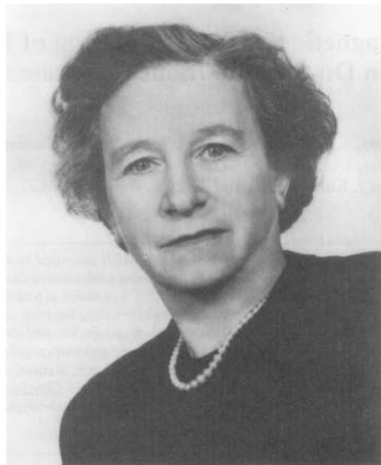
Frieda Fromm-Reichman (1889–1957)

Ellers er det ikke til å komme utenom at jeg blir en del bekymret på egne vegne når jeg drar på smilebåndet, og til og med ler høyt, av de nevnte lydene, selv om jeg bedyrer at det bare er i korte stunder jeg henfaller til slike infantile lyster. Psykoanalysen gir også trøst til en sjel med slike morbide tilbøyeligheter, mener jeg å huske fra psykologistudiet. Jeg tror det var Frieda Fromm-Reichmann som lanserte begrepet "regresjon i jeg'ets tjeneste". Med dette mente hun vel noe i retning av at lek og mange former for kunstnerisk utfoldelse på mange måter er både barnslig og primitivt, men at det samtidig kan være svært utviklende og frigjørende, og si noe viktig om hvem vi egentlig er, uten at dere bør trekke for vidtgående konklusjoner ut fra de nevnte opptakene av menneskelige utslipp. Jeg kjenner imidlertid ikke helt hvor hun satte grensene, så det er mulig at hun ville ha syntes at de nevnte kassetene er i drøyeste laget. Dessverre er det for sent å sende en e-post til henne, men hun har vel etterkommere som kan gi svar. Hvis en psykoanalytiker forviller seg inn på våre nettsider, og leser dette, er jeg glad for korrigering og utdypning. Kanskje vi snakker om et tema for et seminar i lokallagets regi?