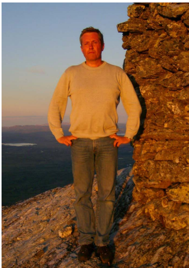
Undertegnede står i solnedgangen og beundrer utsikten fra Skaget mot Jotunheimen, om enn med en bister mine.

I sommer fikk jeg også en påminnelse om hva barn er gode for. Jeg og min datter skulle gå på Skaget, et 1686 meter høyt fjell nord i Valdres, like sør for Jotunheimen. La meg få reklamere litt: Fra Skaget er det utsikt til Jotunheimen, Rondane, Dovre, Hallingskarvet, Hardangerjøkulen, Gaustatoppen og Rendalsølen, for å nevne det grøvste. Den 19 år gamle unge damen er langt fra noe fysisk vrak, og denne gangen ville hun ta i litt, og sette ny ”personlig rekord”. Jeg minnet henne om at hun brukte 62 minutter da hun første gang, fem år gammel, gikk til toppen. Vi gikk vel stort sett det vi kunne, men frøkna ble nok litt lang i maska da vi kom til topps, og klokken viste at vi hadde brukt 57 minutter. Fem minutter framgang på 14 år er ikke mye, men viser vel hvor ivrige barn kan være, under de rette forhold. Da hun var liten, var det nok heller ikke utsikten som lokket. Derimot var det nok veldig om å gjøre å hode tritt med to eldre brødre. Noen motivasjonelle forhold er jo alltid ute og går, og som regel er det ikke så vanskelig å finne noen å spille på når vi har med barn å gjøre. Ellers kan jeg anbefale alle som er glad i flott utsikt å ta en tur på Skaget. Bedre ”betalt” for en times gåing er det vanskelig å få.