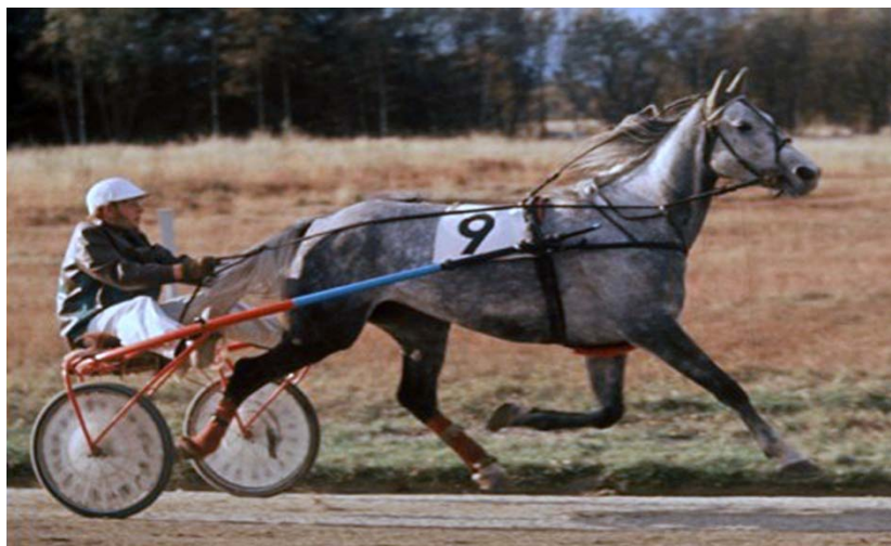
Vilter unghest. Fire år gamle Lady Blue (e. Isorsk og Svava) i fint driv på Forus travbane i 1976.