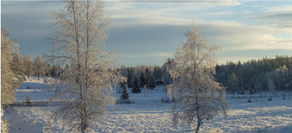
Førjulstemning på Gytsetra.

og laget en plan for å ekstingvere skrikingen. Hun mener at hvis mannen hadde vært psykolog, hadde han vært av «Carl Rogers–typen», men han gikk med på det, og de bestemte seg for å «skinnerisere» barnet. Barnet ble tatt opp kortere og kortere tid, og de ventet lenger og lenger med å ta det opp. Etter fem netter sov barnet som en stein natten gjennom slik at det nesten ble for mye av det gode.