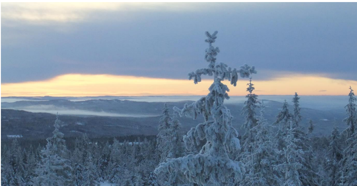
Førjulstemning på Årkjølen, med utsikt mot Odalen og Storsjøen, i lokallagets kjerneområde.

Det eksisterer gale myter og forestillinger om det meste. Vi atferdsanalytikere er selvfølgelig opptatt av de som gjelder oss selv, og vi har hatt vår del. Atferdsanalyse er en minoritet i psykologien, og har standpunkter som bryter med mye annen psykologi og til dels med folkepsykologi. Det blir det lett myter av. Mange dreier seg om at atferdsanalyse bare er aktuelt for dyr, små barn og mennesker med utviklingshemning, at Skinners syn på verbal atferd ble «motbevist» av Noam Chomsky allerede i 1959, og at atferdsanalyse har vært avleggs siden da. To andre er at atferdsanalyse benekter privat atferd, i praksis tenkning og føling, og bare er opptatt av ytre atferd som alle kan observere.