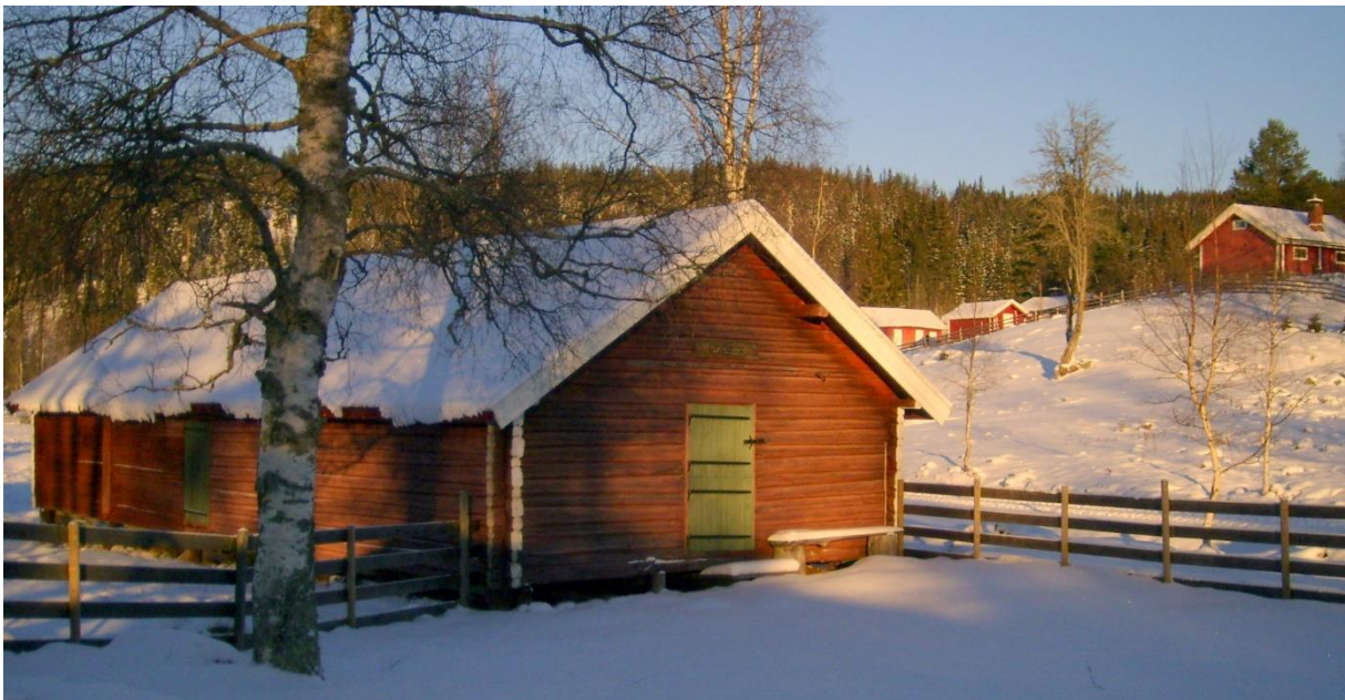
Mer førjulstemning på et av de mest idylliske stedene i lokallagets nedslagsfelt: Grytsetra.