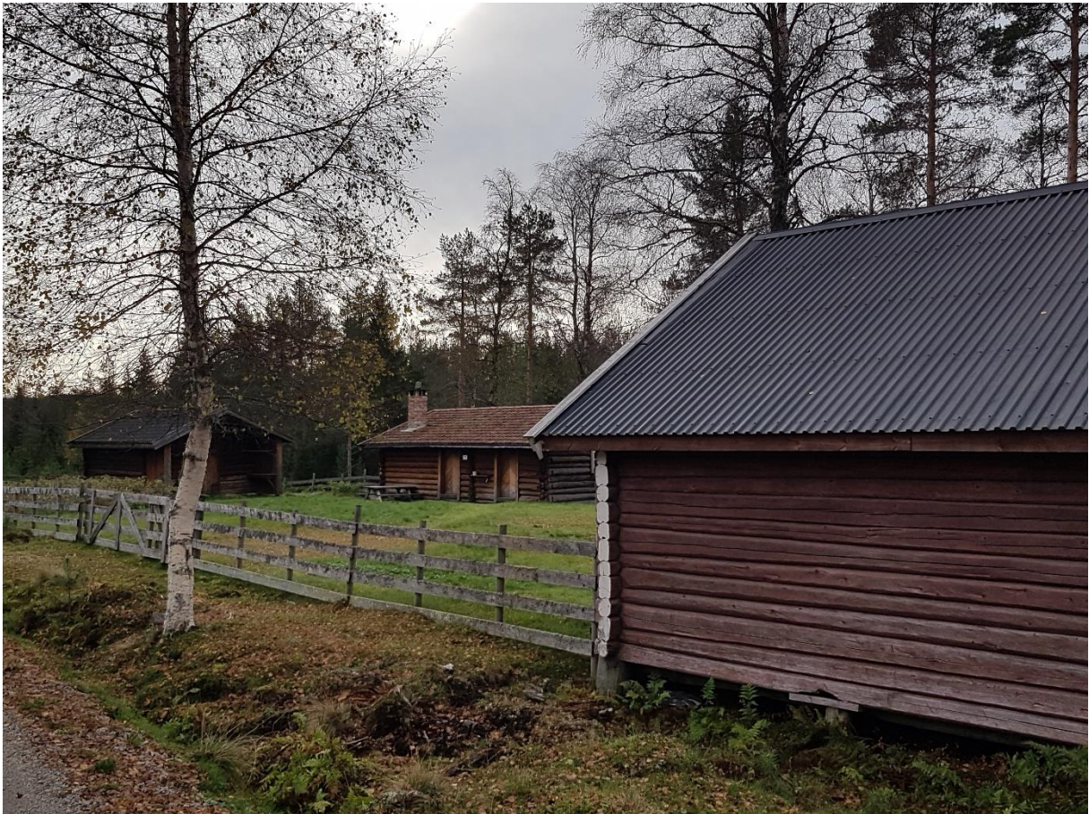
På Grytsetra er det stille etter sommeren, og det har blitt høst.