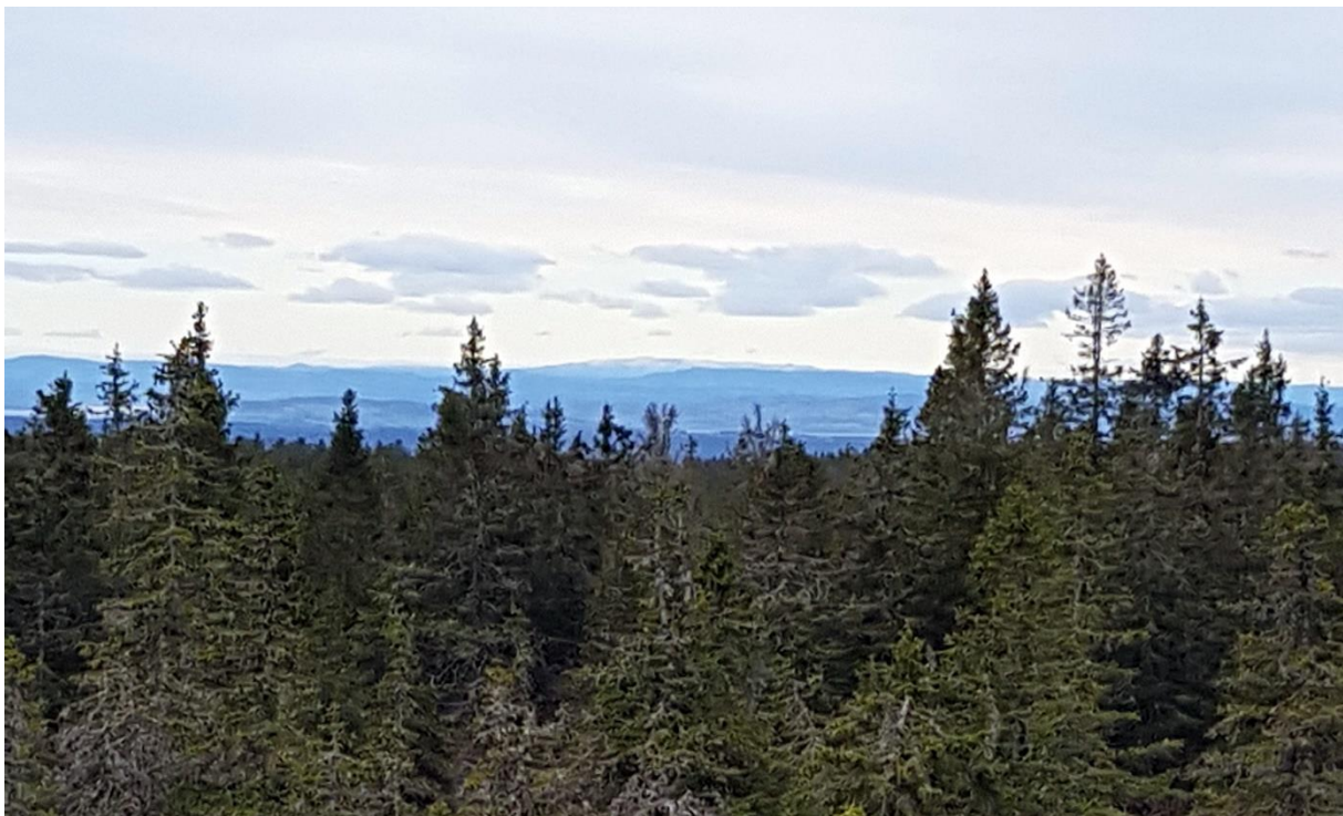
Fin oktoberdag på Årkjølen, med like fin utsikt mot Mjøsa til venstre, og Spåtind i midten.