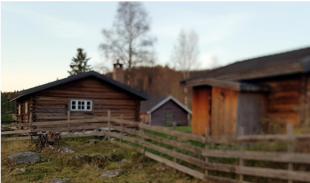
Det har blitt høst på Grytsetra, og det mørkner tidlig. Buskap og budeier har for lengst dratt til bygda.