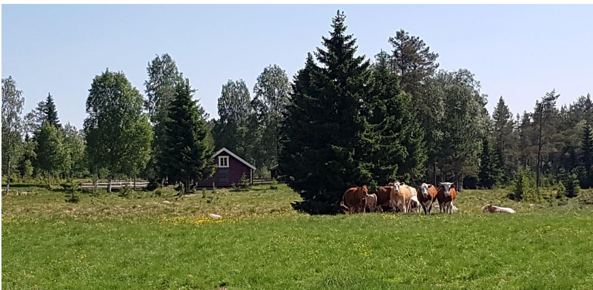
Blåere himmel, grønnere gras, og feitere kuer enn du ser på Grytsetra midtsommers, finnes ikke.