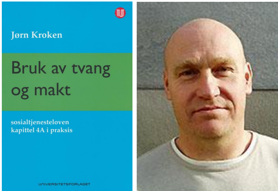
Boken til venstre og forfatteren til høyre, om noen skulle være i tvil.

si da han jobbet i Habiliteringstjenesten i Hedmark. Etter ti år hos oss, begynte han som rådgiver hos Fylkesmannen – en tittel som på mirakuløst vis har unnsloppet likestillingsfolket – i Hedmark. Jeg vil si at han var usedvanlig godt kvalifisert for stillingen. For det første skaffet han seg meget god kjennskap til kapittel 4A i løpet av ti år ”hos oss”. For det andre kjenner han målgruppen for kapittel 4A ut og inn. For det tredje er han meget godt bevandret i