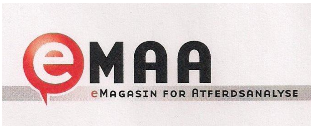
eMAAs profesjonelle logo som snart vil bli sentral i manges bevissthet.

Annen aktivitet i Hedmark har foregått mer i det stille, og med minimal deltakelse fra andre fylker. Jeg ga et hint om det i forrige BBC, og siden da har den rene reklamekampanjen blitt satt i gang, i tillegg til at jungeltelegrafene har hatt travle tider. Jeg tenker selvfølgelig på et nytt tidsskrift som er i kjømda: eMagasin for Atferdsanalyse, eller eMAA. Det er neppe til å legge skjul på at frustrasjonen over NTAs ”forfall”, ikke minst i form av overgang, eller nedgang, til to årlige utgivelser, og signaler som noen tolker som planer om en høyere ”vitenskapelig profil”, har vært en viktig del av motivasjonen. Like før jul, da nyheten om to årlige NTA-utgivelser per år hadde blitt presentert, samlet en gjeng seg til et førjulstreff. Jeg var ikke til stede, men det sies at det var her idéen om et nytt tidsskrift ble unnfanget og de første konkrete planene ble lagt. Den som måtte tro at dette er noe som jeg, avgått redaktør i NTA, har kookt sammen, må altså tro om igjen. Imidlertid er det ingen hemmelighet at de fleste i ”aksjonsgruppen” jobber i Habiliteringstjenesten i Hedmark, og etter hvert vil det bli godt kjent hvem som har ulike verv i det nye tidsskriftet. Jeg kan røpe at redaktøren vil hete Kai-Ove Ottersen, en av våre talsmenn for mottoet ”Det enkleste er det beste”, som i praksis