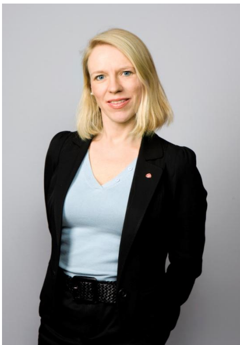
Ikke en flyvertinne i Norwegian, men statsråd Huitfeldt