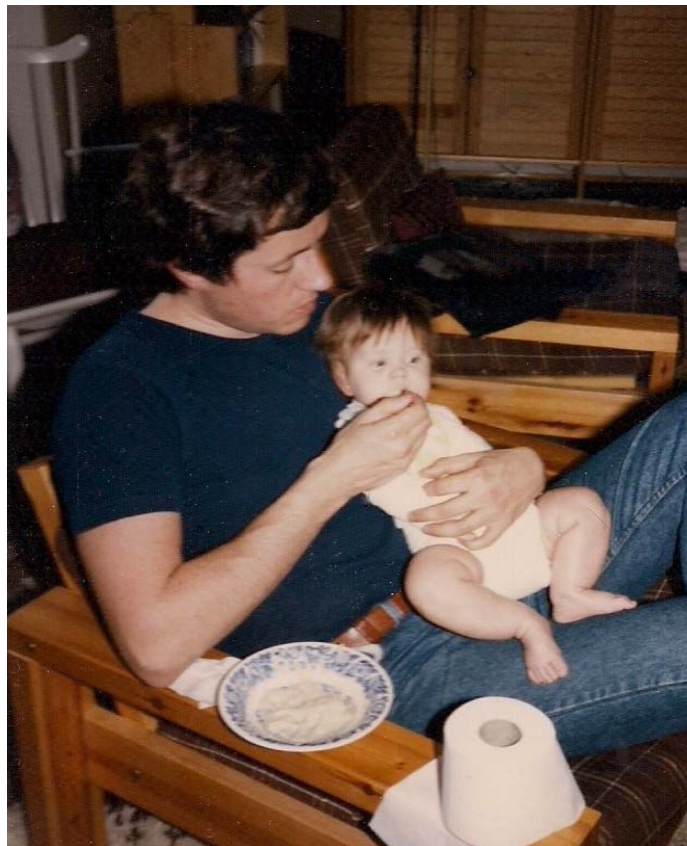
Ung psykolog, muligens med drag på modne damer. Her er han for en gangs skyld opptatt med noe annet...

Også blant personalet var det spennende skikkelser. Jeg husker en tur til Beitostølen, med innlagt fjelltur og greier. Vi bodde i campinghytter, og på et tidspunkt lå det an til at jeg måtte, eller skulle være så heldig å få, dele hytte med en frodig kvinne på rundt 60. Det skulle altså bare være oss to – ingen andre turdeltakere skulle forstyrre. Selv var jeg 28. Dette ble det, kanskje dessverre, ikke noe av. Men etterpå sa hun at "Hadde jeg kømmt i hytte med psykologen, så skulle je ha undersøkt 'n både psykisk og fysisk". Hun mente nok at jeg hadde trengt å bli klådd litt på, og myket opp litt. Alder ingen hindring, som kjent. Hun tok meg også for å være dønn alvorlig, noe hun ikke har vært alene om, med god grunn. Det kom seg imidlertid litt da vi kjørte forbi en sameleir. På skiltet sto det ganske riktig "Sameleir". Jeg lot imidlertid som jeg trodde det sto "Samleier", på min sedvanlige, tørrvittige måte, og lurte på hvilket etablissement dette var. Gudskjelov og takk oppfattet hverken den frodige kvinnen eller andre dette bokstavelig, og spøken reddet meg nok fra å bli oppfattet som å være dømt til et evig liv i seriøsitetens dypeste, evige mørke.